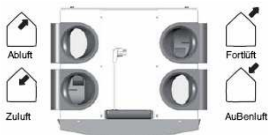
santos 570 (F) DC-L ali santos 570 cool-L