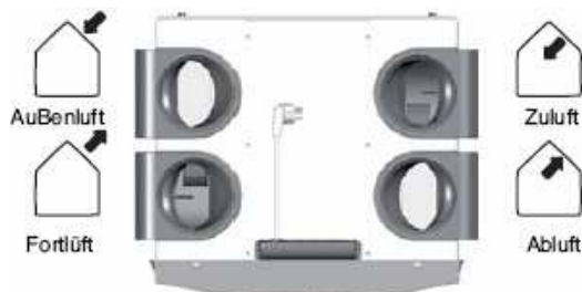
santos 570 (F) DC-R ali santos 570 cool-R