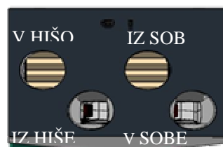
Izvedba DESNO - R