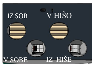
Izvedba LEVO – L

Vse cene so brez upoštevanja cene prevoza iz tovarne do kupca in brez DDV